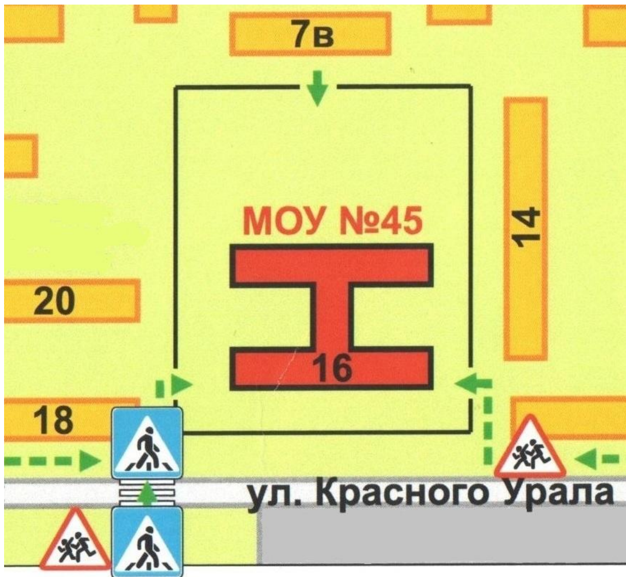
Схема организации дорожного движения в непосредственной близости от образовательного учреждения с размещением соответствующих технических средств, маршруты движения детей и расположение парковочных мест